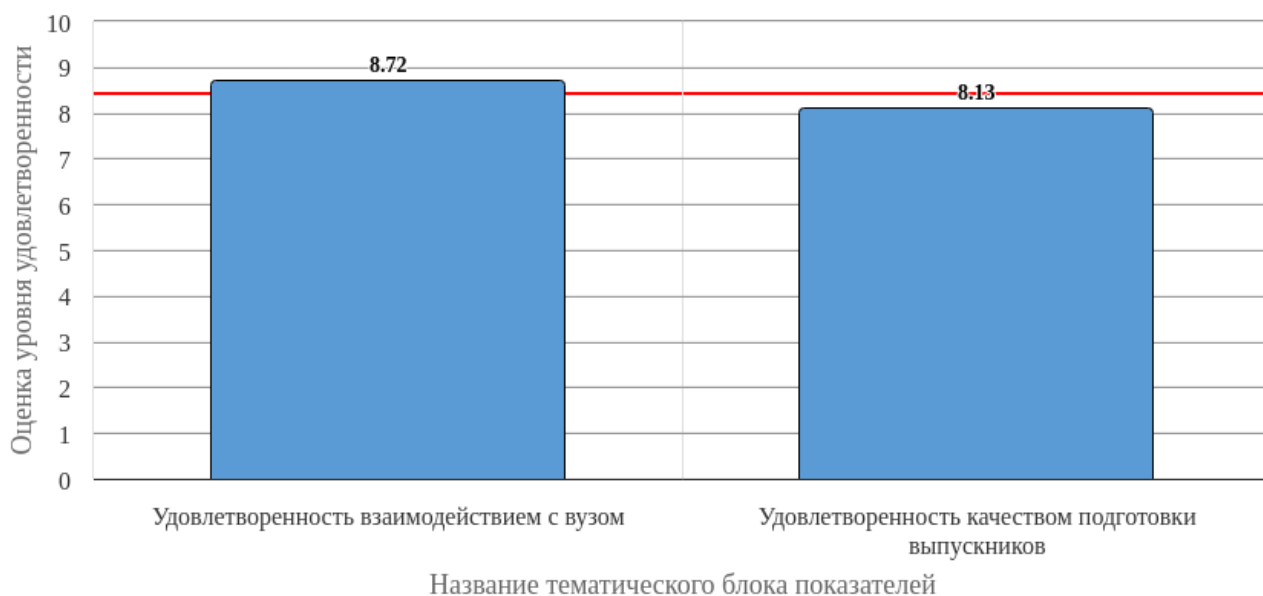
Рисунок 2.1 - Средняя оценка удовлетворенности (по тематическим блокам показателей)

Средняя оценка удовлетворенности респондентов по блоку вопросов «Удовлетворенность взаимодействием с вузом» равна 8.72, что является показателем высокого уровня удовлетворенности (75-100%).